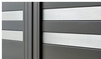
Estacade (uniquement disponible sur Origin 255)